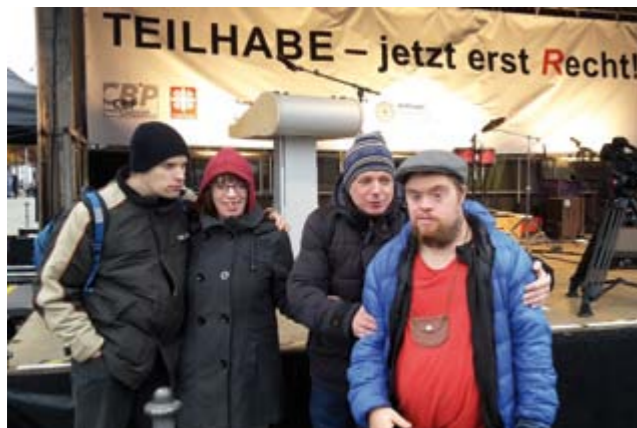
Vor der Bühne am Paul-Löbe-Haus