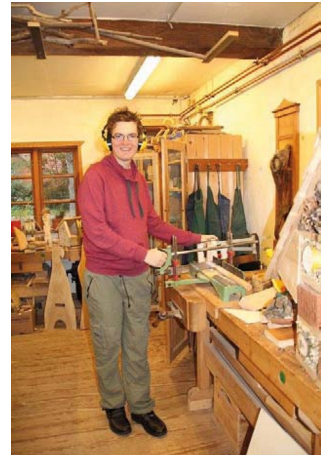
Taddäus macht die Feinarbeit