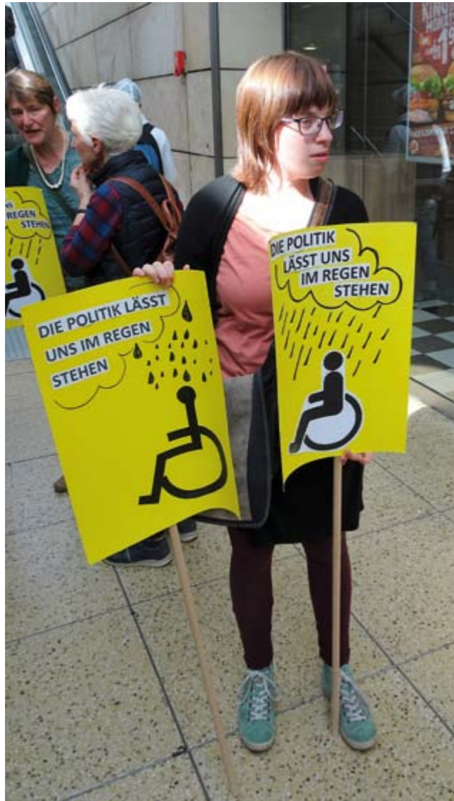
Mathilda als Demonstrantin