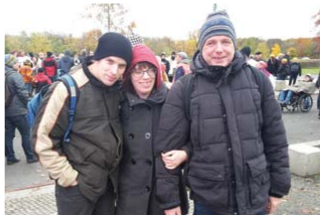
Die Kälte kann uns nicht anhaben