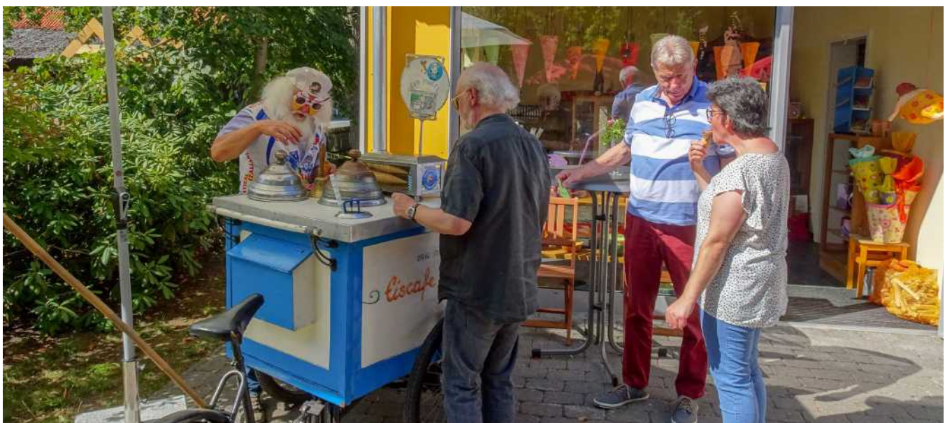
Große Attraktion: Der Eiswagen