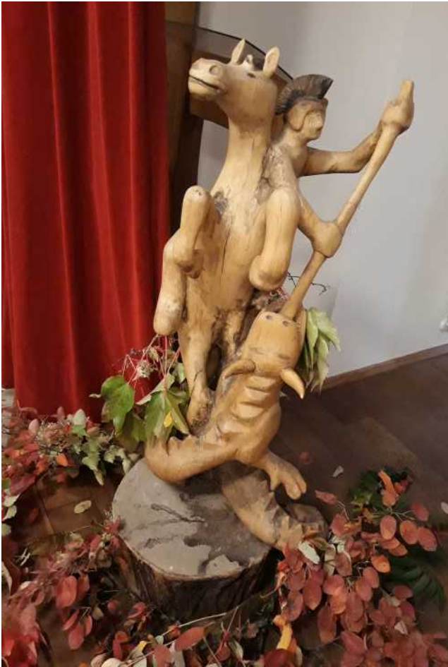
Standbild in der Diele