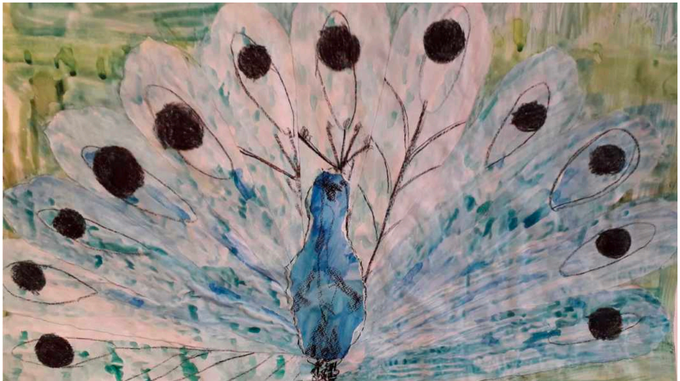
Gerrits gemalter Pfau

und euphorisch auf mich zu.“ Im Raum stehen ein Schälchen mit blauer Farbe und ein vorbereitetes Aquarellpapier. Nachdem mit Sina geklärt ist, dass ich für den TG-Boten einen Bericht schreibe, darf ich an der Therapiestunde teilhaben. Zuerst beginnt die Malstunde immer mit einer Farbmeditation, um erst einmal anzukommen. Bei Sina ist es die Farbe Blau. Claudia fragt Sina, ob sie mit Herbstfarben malen möchte, was diese bejaht. Es entsteht ein Bild mit herbstlichen Farben, die im Vorfeld schon angemischt sind, aber von Sina ausgewählt werden. Auf meine Frage, ob ihr das Malen Spaß macht sagt sie, dass sie gerne hierher kommt. Als nächstes will sie mit Ton arbeiten, das steht schon fest. Meine Hospitation war gleichzeitig spannend und entspannend; ich war beeindruckt von der Ruhe, die die Kunsttherapeutin ausstrahlte.