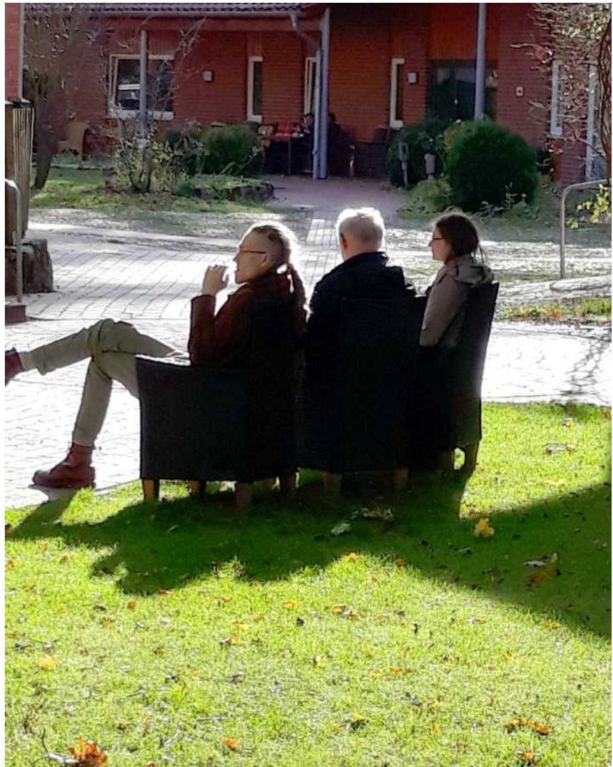
Sich anvertrauen tut gut

Im abschließenden Plenum wurde dieses Erlebnis als durchweg positiv bewertet. „Es kam mir vor wie früher beim gemeinsamen Geschirr abtrocknen, da konnte ich reden. Bei Tisch ging das irgendwie nicht“, sagte jemand. Oder „Ich hatte das Gefühl, man lehnt sich gemeinsam