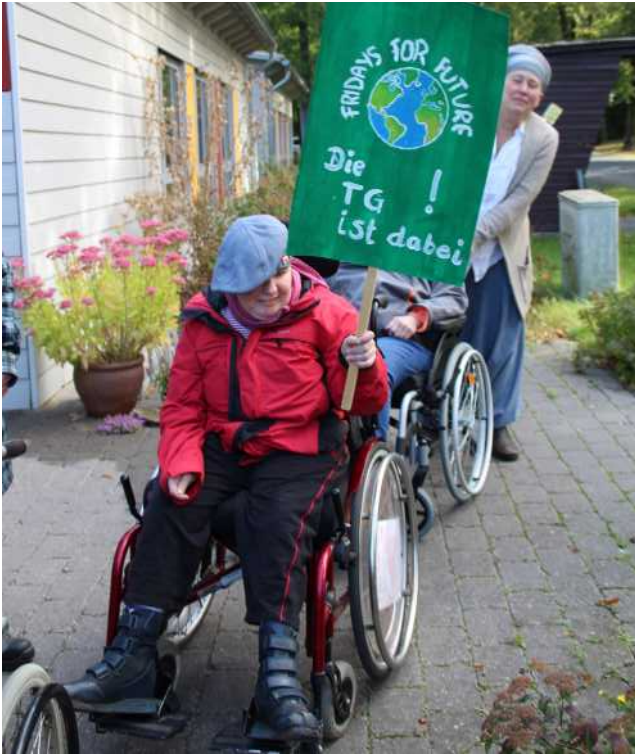
Wir machen mobil ...

„Wir sind dabei!“ heißt es auf unseren selbst gebastelten Transparenten, mit denen wir uns am 27.9. am weltweiten Klimastreik beteiligt haben.