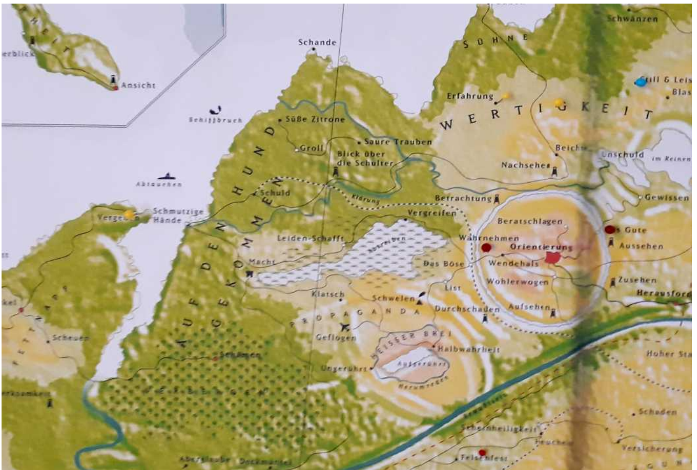
Landkarte der Befindlichkeiten