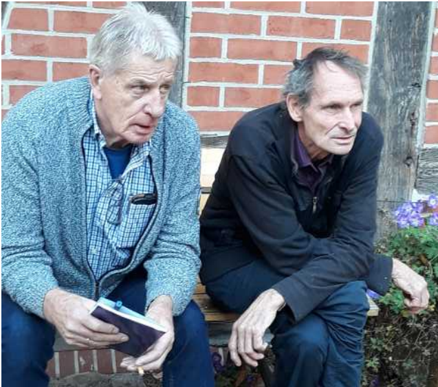
Ins Gespräch vertieft